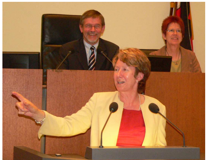
Während meiner Rede zum Thema Biodiversität im Landtag am 13. November 2008

Wer für den Erhalt der Biodiversität einsteht, der schützt das, was unsere Lebensgrundlage ist. Denn nur funktionierende Ökosysteme bieten uns das, was wir zum Überleben brauchen: Sauberes Wasser, gesunde Luft und Böden, auf denen wir anbauen können. Im Novemberplenium haben wir über mehrere Anträge zum Thema biologische Vielfalt abgestimmt. Die Fraktion der Grünen hatte einen Antrag eingereicht, der die Forderung, den Rückgang der biologischen Vielfalt aufzuhalten, mit konkreten Maßnahmen und konkret zu erreichenden Zielen untermauerte. Es ist erschreckend, dass die niedersächsische Landesregierung nicht einmal die Standards einführen will, zu denen sich sogar die Bundeskanzlerin bekennt. Denn das Bundeskabinett hat ihre nationale Strategie zur biologischen Vielfalt schon im Jahr 2007 beschlossen. Der Antrag der niedersächsischen Grünen enthielt im Wesentlichen das, was sich auch in der nationalen Strategie finden lässt, trotzdem lenkten die Regierungsfractionen nicht ein. Als SPD-Fraktion hatten wir darüber hinaus einen Er-